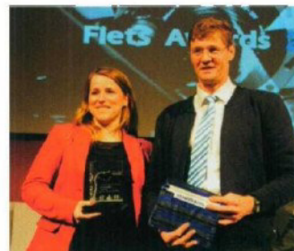
Isabelle Weymans, minister van Cultuur, Media en Toerisme van de Duitstalige Gemeenschap in België met de award

België, het Signaal van Botrange op 694 m hoogte. Leuk voor bijvoorbeeld het hele gezin is de nieuwe permanente tentoonstelling Fania over de Hoge Venen. Hierbij loopt een houten pad als rode draad door de tentoonstelling. Het pad neemt je op sleeptouw langs verschillende thema's, zoals het klimaat en de ondergrond van de venen tot het landschap zoals het was vóór de komst van de mens. Veel fietsfun!