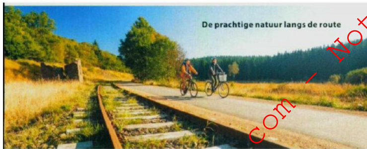
De prachtige natuur langs de route

zijn er genoeg mooie dingen te zien langs de route. Zo ontdek je in Aken zeker niet aan de beroemde Dom. Deze bisschoppelijke kerk, waarvan de bouw werd gestart in 796 na Chr., staat sinds 1978 op de UNESCO-erfgoedlijst. In de bedevaartskerk zijn ruim 30 Duitse koningen gekroond en het is zelfs de begraafplaats van Karel de Grote. Ook het Duitse stadje Monschau (de parel van de Eifel) vlakbij Aken is zeker de moeite waard. Monschau is vooral populair bij toeristen door de mooie ligging in een diep dal langs de rivier de Roer, de historische architectuur en het vele groen. Langs de Roer (een zijrivier van de Maas) vind je prachtige herenhuizen en schitterende vakwerkhuisen. Een aanrader is het Rode Huis ('Rote Haus'), dat het mooiste herenhuis van de stad is. Ook trekt Monschau veel toeristen die het Nationaal Park Eifel bezoeken, een park in de regio Noordrijn-Westfalen met een oppervlakte van 110 km 2 . Een andere toeristische trekpleister is het natuurparkcentrum Botrange in Robertville, een klein Waals plaatsje in de provincie Luik. Het natuurcentrum van Botrange ligt in het hart van de Hoge Venen, vlakbij het hoogste punt van