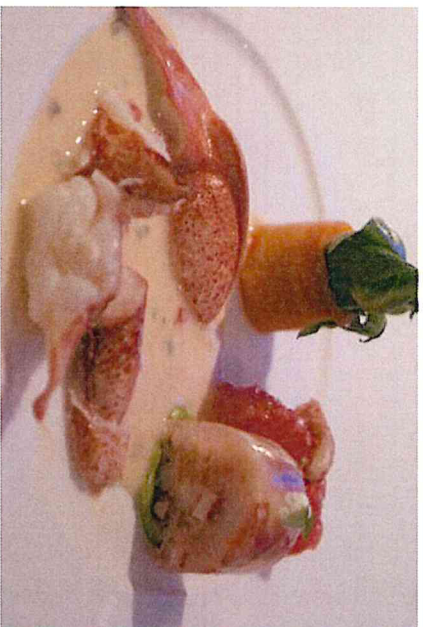
Luxe dineren in Luxemburg

Cleraux: Boutique & Design Hotel Le Cleraux, 8 Grand-rue. Een hotel waarin je het liefst ook een dagje gewoon binnen wilt blijven.