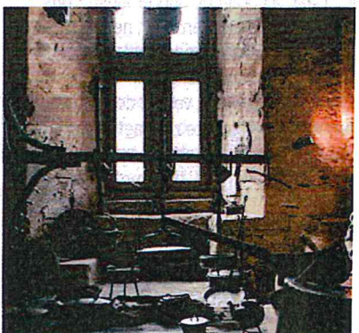
Het kasteel in Vianden is erg interessant, v. andere door de nauwe relatie met ons kon