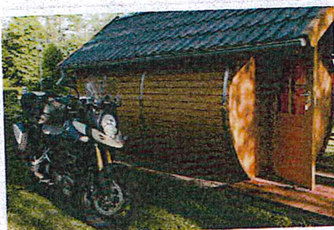
Een ander type trekkershut: in de vorm van een wijnavat. Voorportaalje en twee stapelbedden, maar voor vier volwassen personen wel krap...

Het eerste stenen bouwwerk, dat het kasteel van Bourscheid gaat heten, ontstaat in het jaar 1000. De latere buitenmuur is uit de veertiende eeuw. In het begin van de negentiende eeuw verliet de laatste adellijke bewoner het bouwwerk, waarna het verval intrad. In 1972 werd de staat eigenaar en sindsdien wordt er regelmatig een deel gerenoveerd. Het is de tweede helft van mei: op veel plekken staat de brem uitbundig te bloeien. Soms zie je tegen de heuvels grote gele bremvelden. Op een zonnige dag als vandaag maakt de brem het rijden hier extra feestelijk. De terrasjes in Larochette zijn te leuk om voorbij te rijden. De geitenkaassalade is smakelijk en een stukje verderop - de ruïne van het slot Larochette prachtig. Het slot is in de twaalfde eeuw gebouwd. In de zestiende eeuw trof een grote brand het kasteel: sindsdien is het een ruïne. Het laatste kasteel dat ik aandoe, is dat van Ansembourg. Dit is nog niet zó oud: het is in de zeventiende