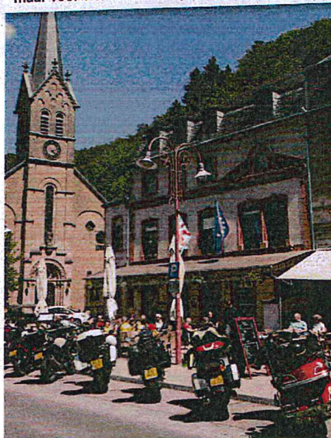
Larochette is een alleraardigst dorp met veel terrasjes. Een mooie plek om even te stoppen.