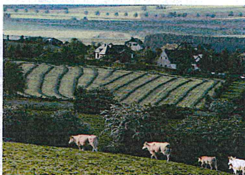
Het drogende gras op de hellingen zorgt voor een extra mooi landschap.