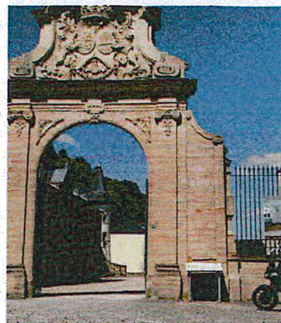
Ongekend mooi: dit kasteel in Ansembourg. Met gratis toegankelijke barokke tuin.