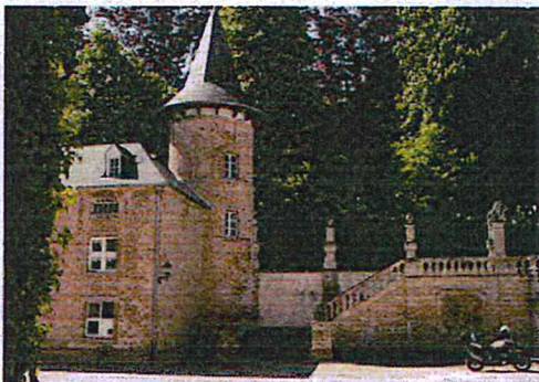
Bij kasteel Ansembourg staat de motor 'binnen' en kun je lekker uitrusten in de prachtige tuin.

eeuw gebouwd als onderkomen van een rijke familie. Er zijn bruiloften en partijen mogelijk, maar mijn interesse gaat meer uit naar de barokke tuin met historische fruitbomen, kruiden, hagen en bloemen. Vrij toegankelijk! De laatste twee nachten verblijf ik op campings. Ook zonder tent kun je hier goed en goedkoop over-