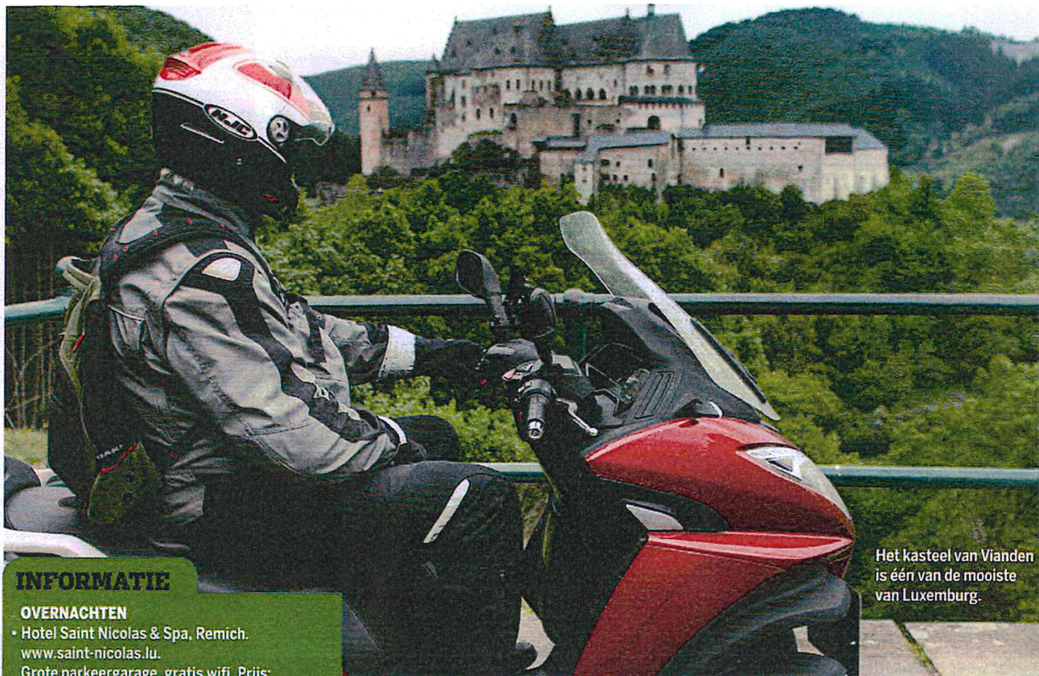
Het kasteel van Vianden is één van de mooiste van Luxemburg.