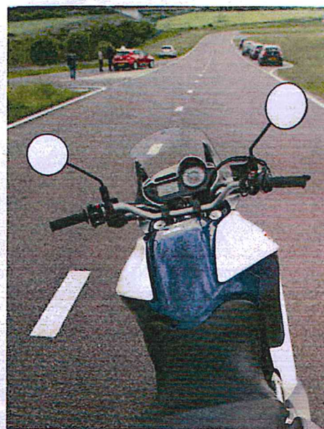
Dat is schrikken: zittend in de rode auto is deze motor nergens te zien. En bij 90 km/h maar luttele seconden verwijderd van de auto.

nachten, bijvoorbeeld in een chalet, stacaravan of trekkershut. Op Camping Bissen verblijf je dan idyllisch langs de Sûre. Camping Bleesbruck is gunstig gelegen voor bezoeken aan Vianden, Diekirch, het Mullerthal en - ook met de trein - de hoofdstad. Luxemburg op de motor. Het land mag dan klein zijn maar genoeg krijg je er nooit van! "