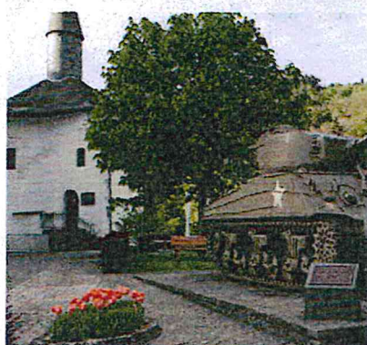
Ook Luxemburg heeft veel te lijden gehad v. Ardennenoffensief.