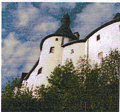
Clervaux heet de motorrijder van harte wel