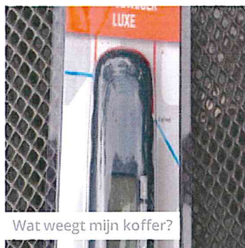
Wat weegt mijn koffer?