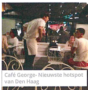
Café George- Nieuwste hotspot van Den Haag