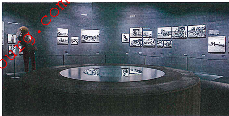
Fototentoonstelling 'The bitter years' van Steichen in een oude watertoren in Dudelange

'The bitter years' is een fototentoonstelling welke is opgezet door Edward Steichen, voormalig directeur van de fotografieafdeling van het New Yorkse MoMA (Museum of Modern Art). De tentoonstelling dateert uit 1962, maar de foto's zijn genomen in de periode 1935-1941. The bitter years laat in ruim 200 beelden een impressie zien van het Amerika van vorige eeuw. Armoede, droogte en emoties. Een exodus en een vlucht naar een beter bestaan. Foto's die gemaakt zijn door de Farm Security Administration.