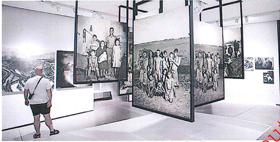
Fototentoonstelling 'The Family of Man' in het kasteel van Clervaux

De tentoonstelling 'The Family Of Man' ligt in een oud kasteel in Clervaux in het noorden van Luxemburg. Clervaux is een gemoedelijk stadje met in de omgeving veel kerken en kastelen. Je hoort wel eens dat je Clervaux niet over mag slaan als je Luxemburg bezoekt, en eigenlijk kan ik dat wel beamen. Al heeft dat helaas ook tot gevolg dat het stadje vrij toeristisch is... Maar daar heb ik tijdens de fototentoonstelling geen last van gehad!