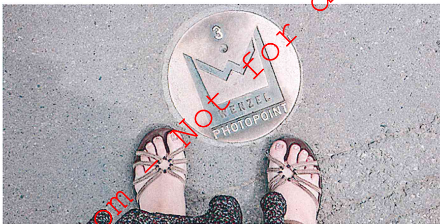
Aandachtig voor fotografie tijdens de Wenzel wandelroute

Voor de mensen die écht niet na willen denken over hoe ze een foto moeten maken zijn er bovendien metershoge rood-wit-gestreepte frames te vinden. In handig vierkant formaat, zodat je uitsnede meteen geschikt is voor Instagram.