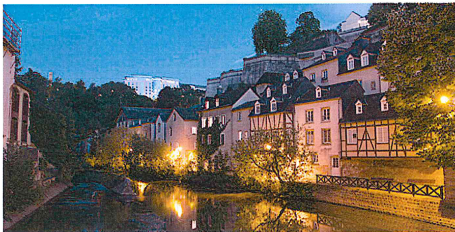
Munster tijdens het blauwe kartier

Een snelle lift brengt je naar beneden naar de Rue Münster met kleine bruggetjes over de Neizecht. De gekleurde gebouwen langs de rivier, inclusief een aantal vakwerkhuisjes, spiegelen in het kabbelende water. Als je lang kijkt gaan de reflecties een eigen leven leiden.