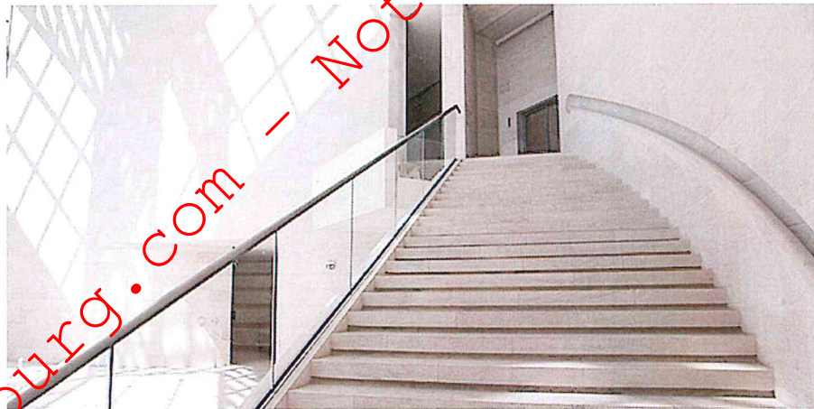
Als je van architectuur fotografie houdt mag je het MUDAM in Luxemburg niet overlaan

In hetzelfde museum zijn wisselende tentoonstellingen van andere fotografen.