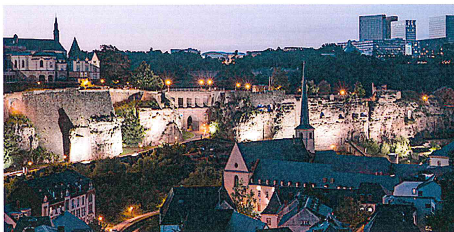
De kazematten van Luxemburg in de avondschemering.

Een minuutje verderop vind je een uitzichtpunt van waar je het lagere gedeelte van Luxemburg kan overzien. De kleine slingerende straatjes. De rivieren en stroompjes die als donkere aders door de stad stromen. De fraai verlichte gebouwen. En natuurlijk de kazematten.